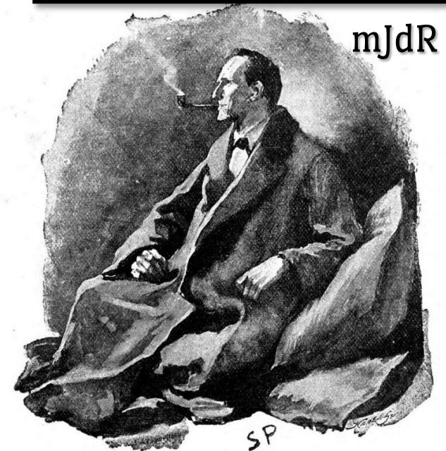
Imagen de portada: Sidney Paget, Public domain, via Wikimedia Commons.